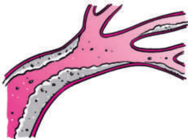
Slagaderverkalking Vetachtige stoffen hopen zich op in de vaatwand

Bij sommige mensen komen risicofactoren als hoge bloeddruk, te hoog cholesterol en diabetes mellitus in de familie veel voor.