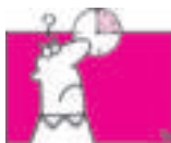
Hoe laat is het begonnen?

Hulpmiddel: vraag aan de persoon een zin uit te spreken